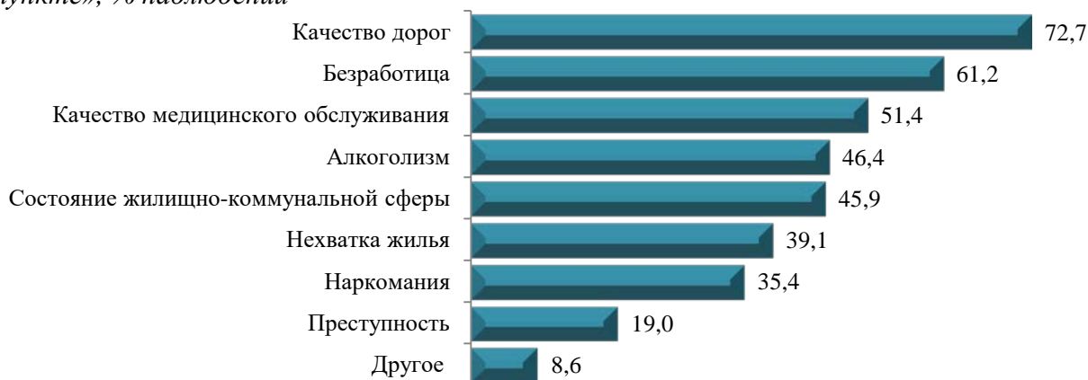
Рис. 1. Распределение ответов респондентов на вопрос: «Укажите, пожалуйста, 5 наиболее острых проблем, требующих решения в первую очередь в Вашем населенном пункте», % наблюдений 1

Наиболее существенными проблемами в представлениях жителей Приморского края являются плохое качество дорожного полотна (72,7%), безработица (61,2%) и низкое качество медицинского обслуживания (51,4%). Также первоочередного решения требуют проблемы высокого уровня алкоголизма среди населения (46,4%) и состояния жилищно-коммунальной сферы (45,9%). В общем рейтинге проблем Приморского края, проблема распространения немедицинского потребления наркотических средств занимает одно из последних мест – лишь треть населения региона выражают обеспокоенность проблемой (рис. 1).